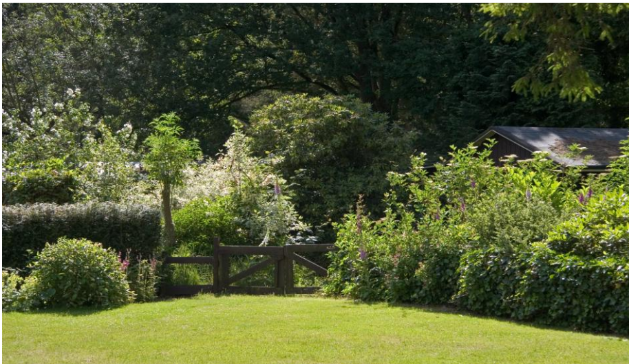
huisjes verscholen in het groen

Geachte aanwezigen, de ontheffing die wij hier bestrijden, betreft de versterking van de ringslang, de das en de gewone dwergvleermuis, voor de herinrichting van de recreatieparken De Ridderhof en Puur in Lage Vuursche.