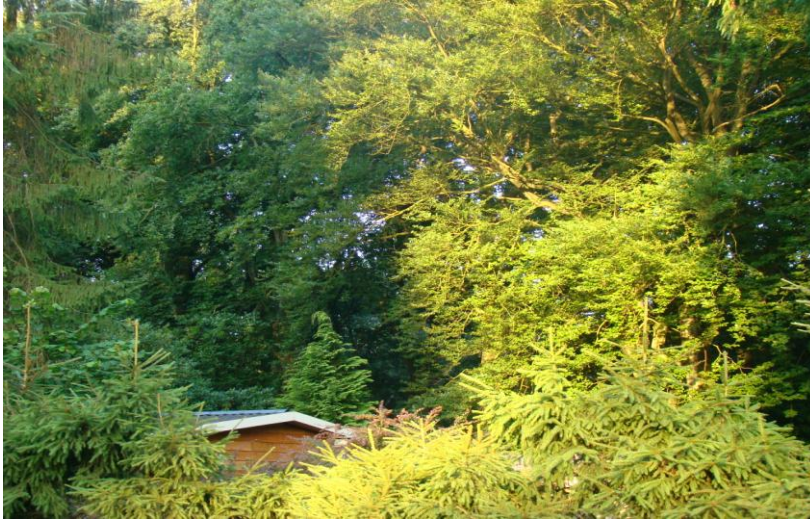
bungalowpark De Ridderhof

Geachte aanwezigen, de ontheffing die wij hier bestrijden, betreft de versterking van de ringslang, de das en de gewone dwergvleermuis, voor de herinrichting van de recreatieparken De Ridderhof en Puur in Lage Vuursche.