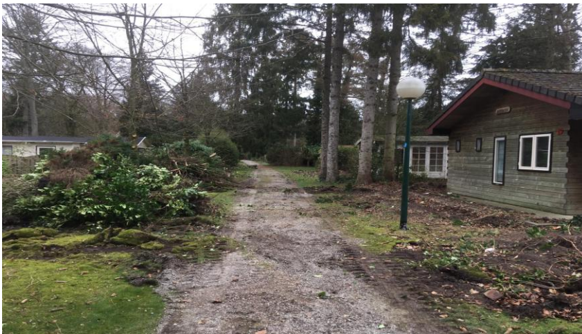
kaalslag na kappen voorjaar 2019

Er is in de ecologische rapporten sprake van het aanleggen van een nieuwe groene corridor. Dit kan echter nog niet plaatsvinden omdat er nog huisjes staan. Daarnaast is er nog enkele geen zekerheid over het herinrichtingsplan (c.q. de plantekeningen). Dit maakt het verwijderen van zoveel bomen en struiken ongewenst en voorbarig. Het is immers goed mogelijk dat de eigenaar de plannen moet veranderen, als de gewenste wijziging van het bestemmingsplan er niet komt. Op dit moment is er nog niet eens een (voor)ontwerpbestemmingsplan.