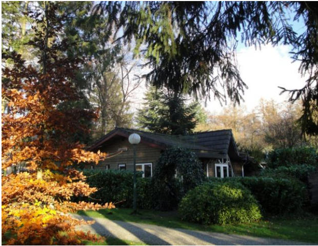
vóór het kappen/rooien voorjaar 2019

en als duidelijk is dat er geen alternatief is. Dan zijn ook pas mitigerende maatregelen aan de orde.